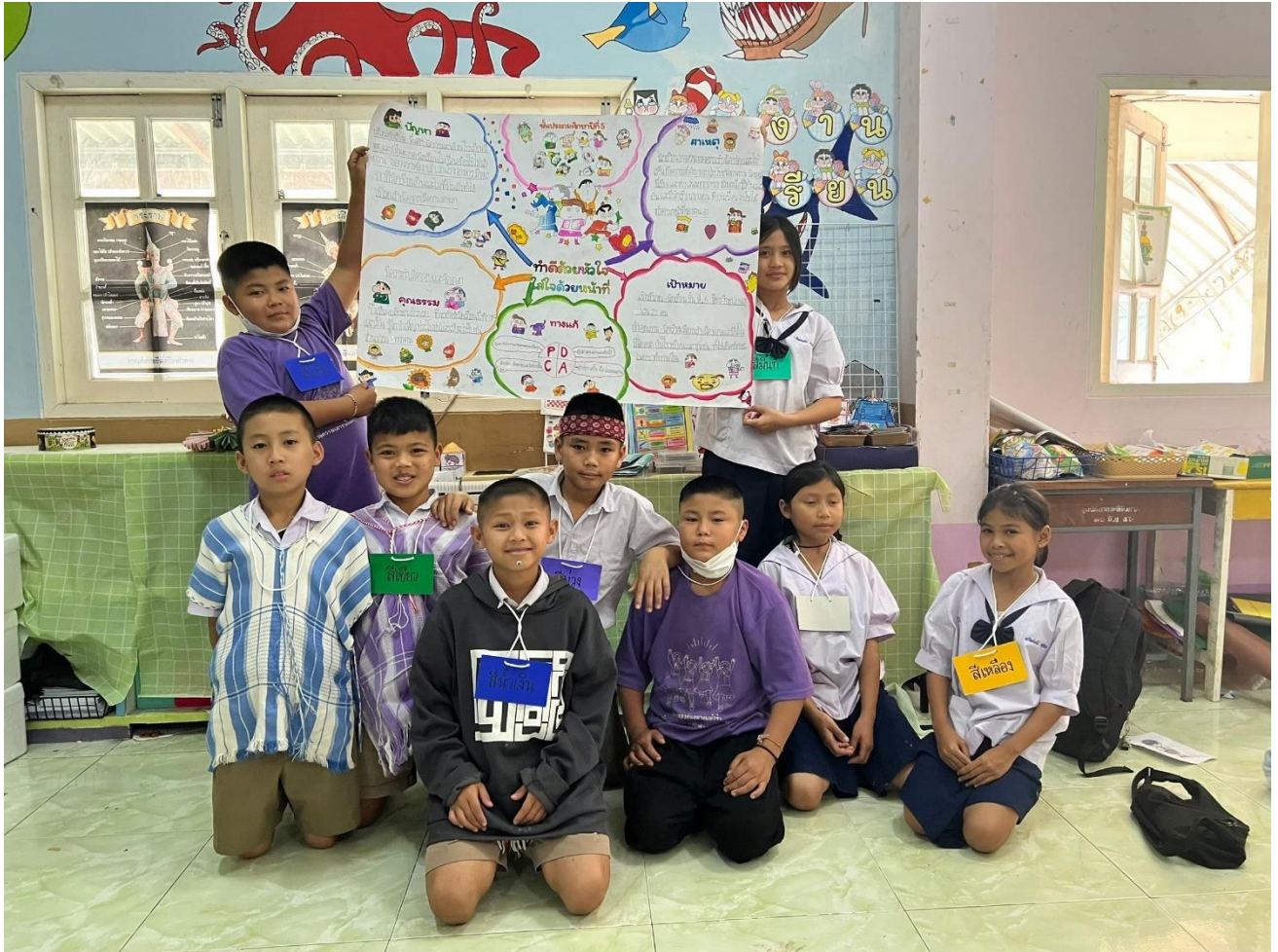
กิจกรรมห้องเรียนคุณธรรมระดับชั้นประถมศึกษาปีที่ ๕ ปีการศึกษา ๒๕๖๗