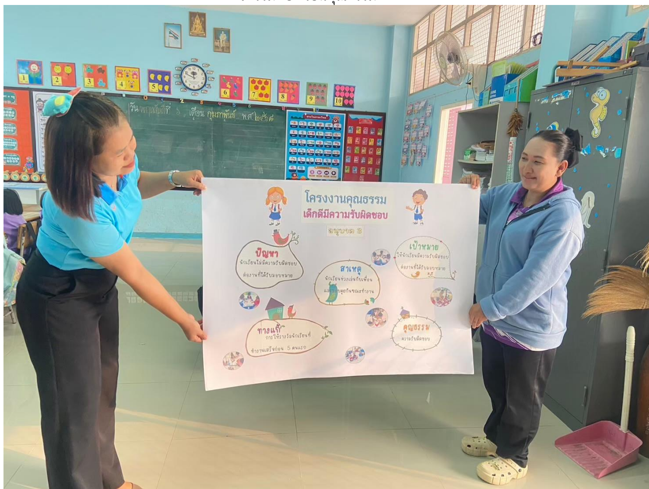
กิจกรรมห้องเรียนคุณธรรมระดับชั้นอนุบาล ๑ - ๓ ปีการศึกษา ๒๕๖๗