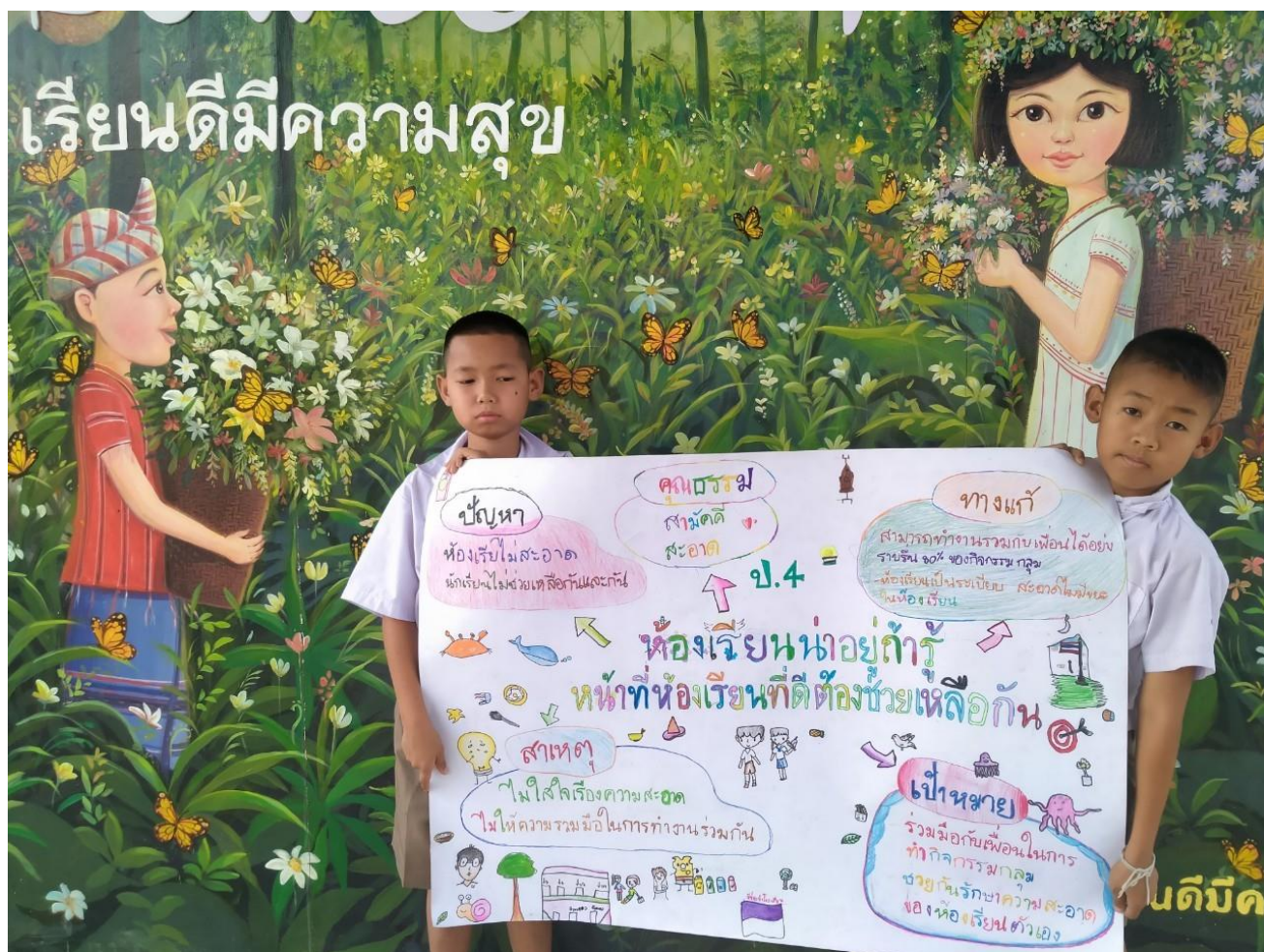
กิจกรรมห้องเรียนคุณธรรมระดับชั้นประถมศึกษาปีที่ ๔ ปีการศึกษา ๒๕๖๗